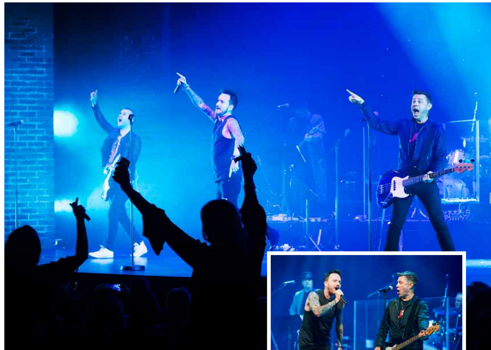
80-TALS NOSTALGI. Ett par veckor efter intervjun med Noice uppträder gruppen på "Tillbaka till 80-talet" med en rad andra artister på Göta Lejon. Jubel och applåder utbryter när Noice antrar scenen och publiken stämmer tillsammans med gruppen upp i 80-tals hiten "Du lever bara en gång och den gången e nu. Finns bara en som vet hur du ska leva och det e du."

- Det är jätteroligt och det är alltid bara skön stämning. Folk kommer helt enkelt för att ha kul.