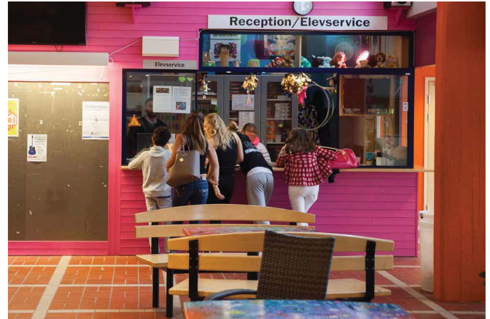
TRENDEN HAR vänt. Nu söker sig fler elever till Brandbergsskolan.

RESULTAT Enligt lärarna har det blivit mycket bättre arbetsro och hjärtligare stämning. Elevernas engagemang i skolarbetet har också ökat i takt med att lärarna börjat samarbeta mer. Dessutom har elevtillströmningen ökat för första gången på tio år.