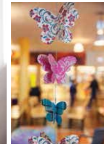
TYDLIGHET OCH transparens är en röd tråd i förändringsarbetet.