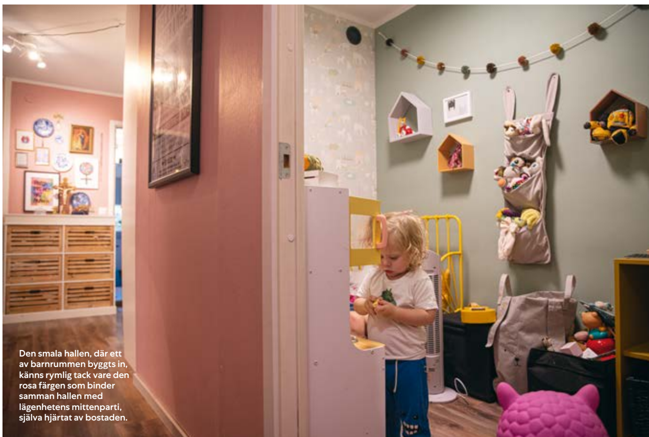
Den smala hallen, där ett av barnrummen byggts in, känns rymlig tack vare den rosa färgen som binder samman hallen med lägenhetens mittenparti, själva hjärtat av bostaden.