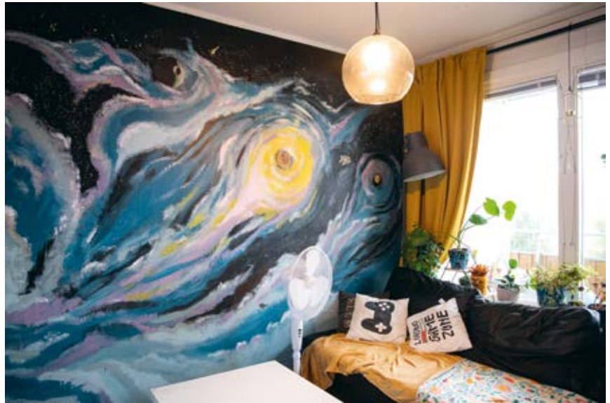
OVAN: Harry Potter- och Starwars-tema präglar hela det pyttelilla vardagsrummet – där inte minst all färg bidrar till ett större helhetsintryck. TILL VÄNSTER: Jackie, 2, delar sitt mysiga lilla rum med alla gosedjuren.